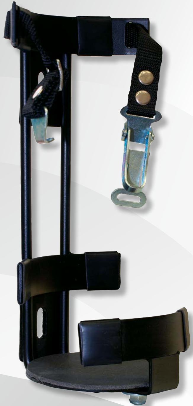
Kfz-Halter KH 6/9V