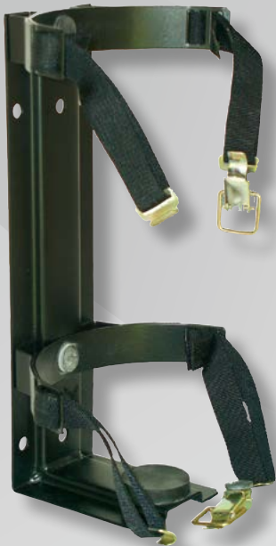
Kfz-Halter KR 6